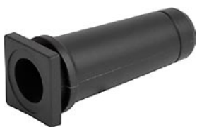
4311.9309 PVC Knickschutztülle zu Kabelstecker