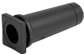
4311.9324 PVC Knickschutztülle zu Kabelstecker