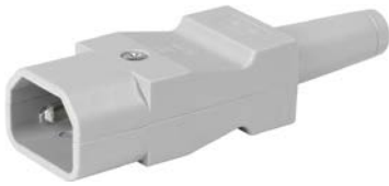
Für Kabelmontage grau gerade