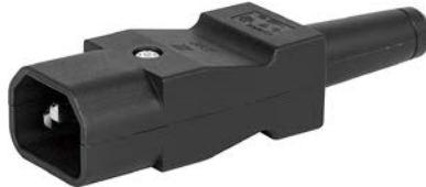
Für Kabelmontage schwarz gerade