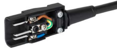
Beispiel mit angeschlossenem Kabel